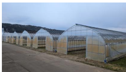
▲ビニールハウス組み立て中