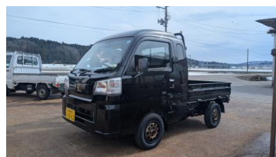
▲新車（軽トラ）買いました😊